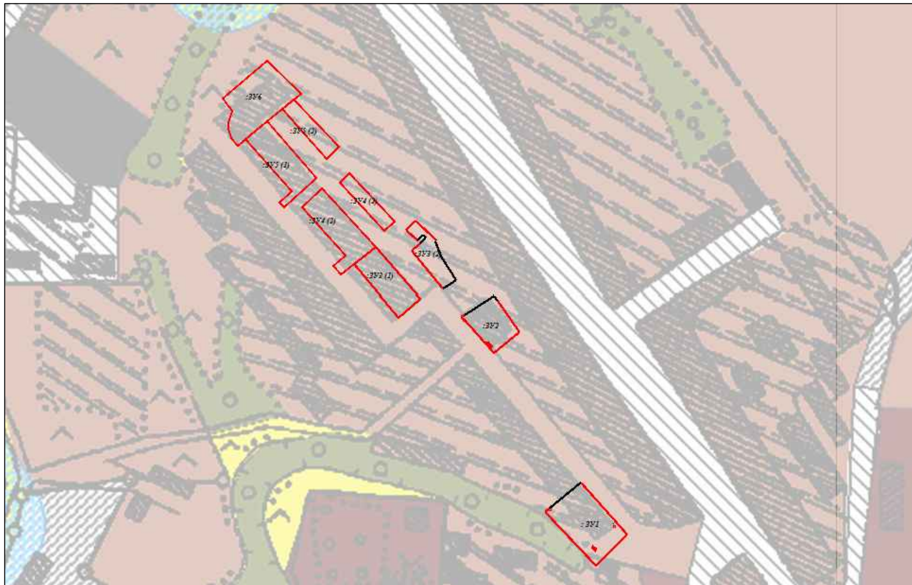
Схема расположения земельного участка на карте градостроительного зонирования М 1:3000